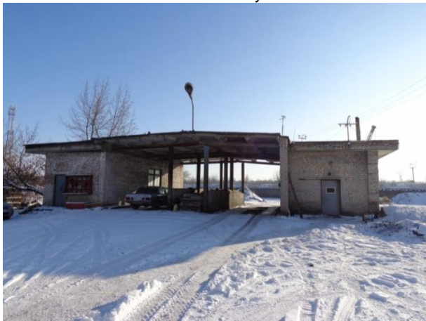
Фото 13. Здание весовой