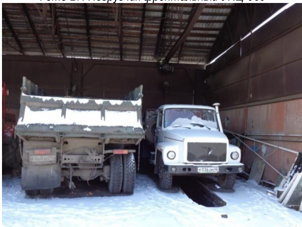
Фото 29. А/м Камаз