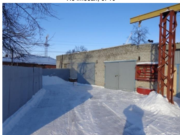
Фото 4. Имущественный комплекс по адресу: г. Курск, ул. Почтовая, д. 19