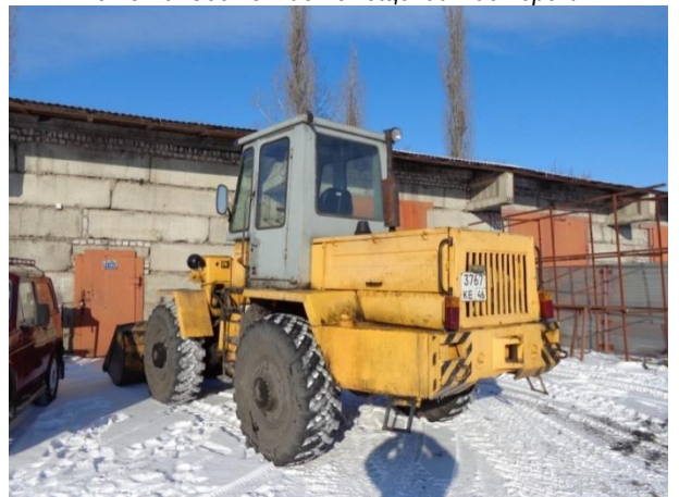
Фото 28. Погрузчик фронтальный ТО-30