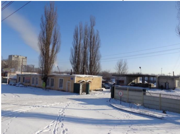
Фото 9. Имущественный комплекс по адресу: г. Курск, ул. Пост-Кривец, д. 11