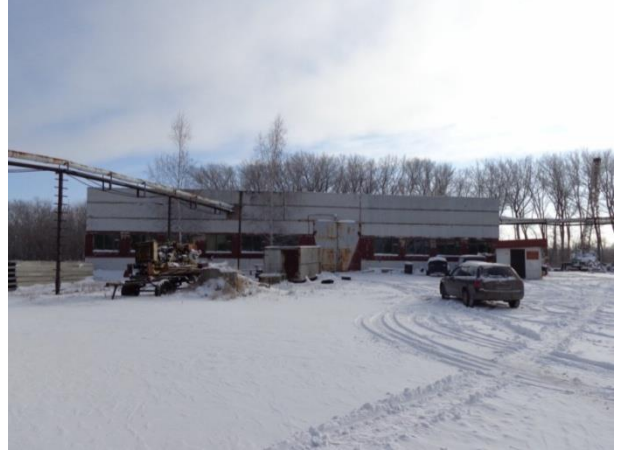
Фото 20. Мастерские