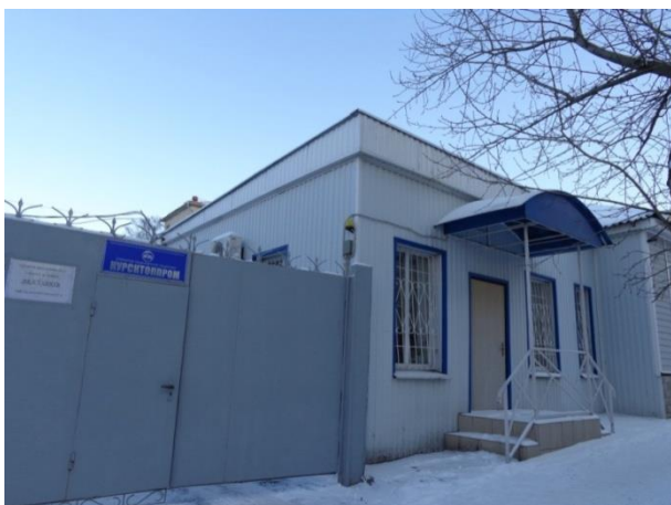
Фото 1. Имущественный комплекс по адресу: г. Курск, ул. Почтовая, д. 19

Далее представлены материалы фотофиксации.