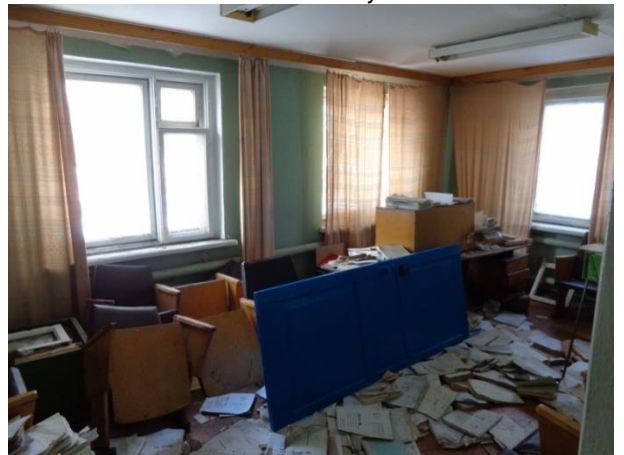
Фото 24. Состояние помещений административного здания