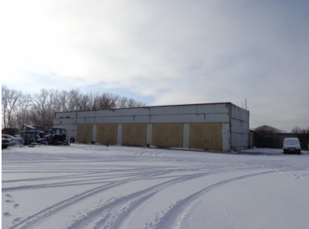
Фото 19. Автогараж