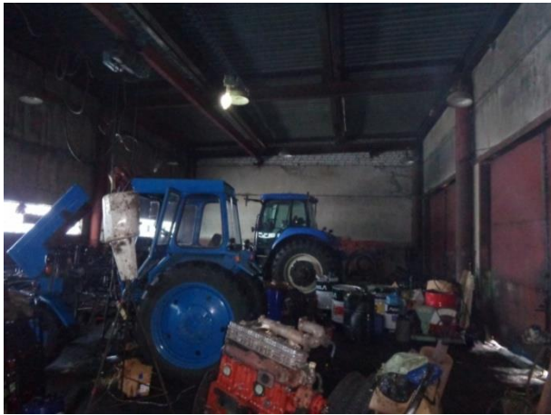
Фото 25. Состояние помещений автогаража