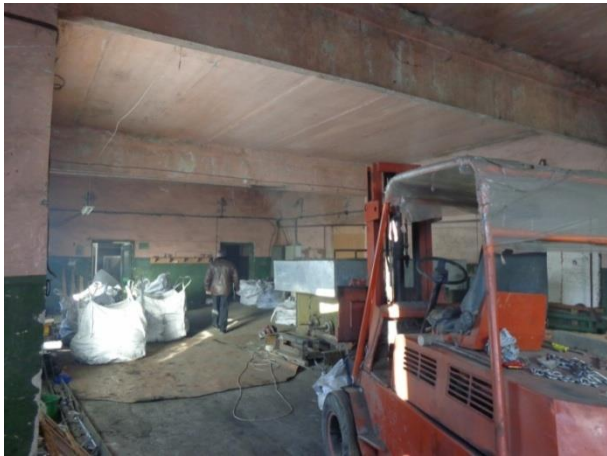
Фото 15. Состояние помещений производственного цеха