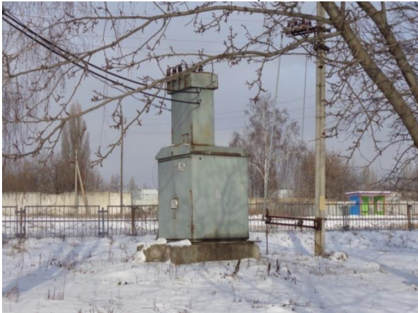
Фото 21. Трансформаторная подстанция