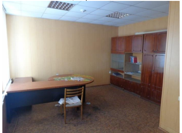
Фото 16. Состояние помещений административного здания