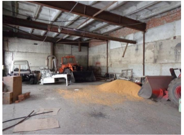
Фото 26. Состояние помещений мастерских