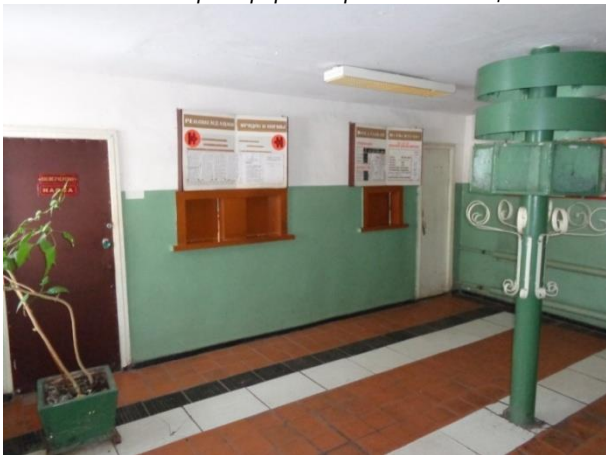
Фото 23. Состояние помещений административного здания