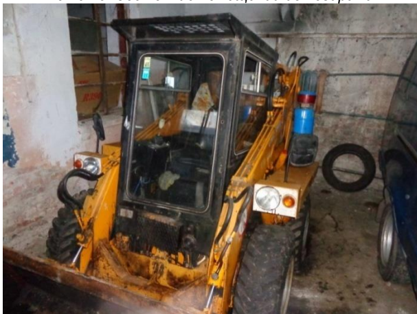
Фото 27. Погрузчик фронтальный УНЦ-060