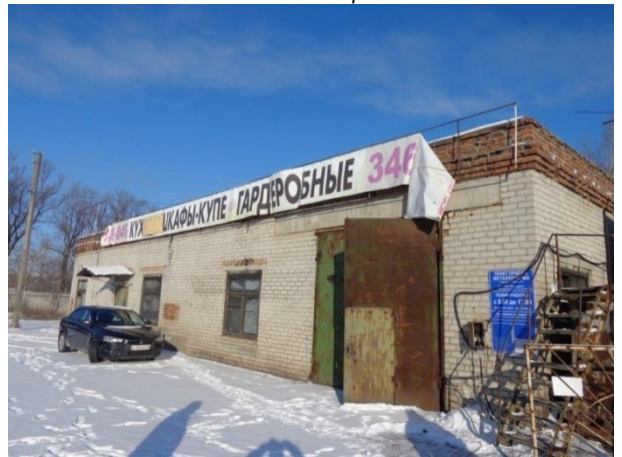
Фото 14. Цех производственный