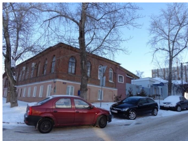
Фото 2. Имущественный комплекс по адресу: г. Курск, ул. Почтовая, д. 19