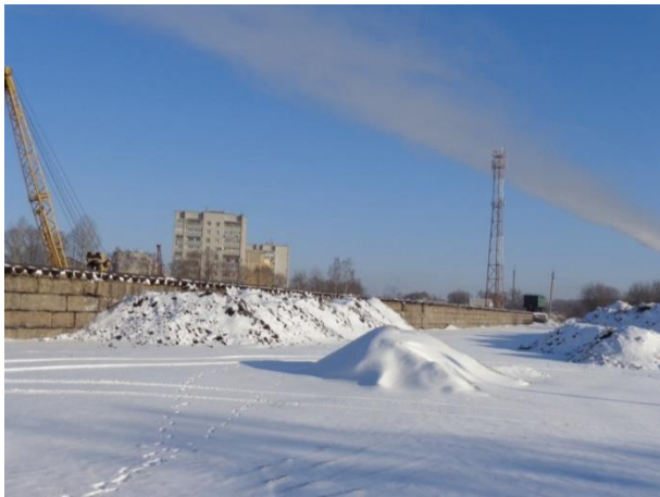
Фото 11. Ж/д тупик