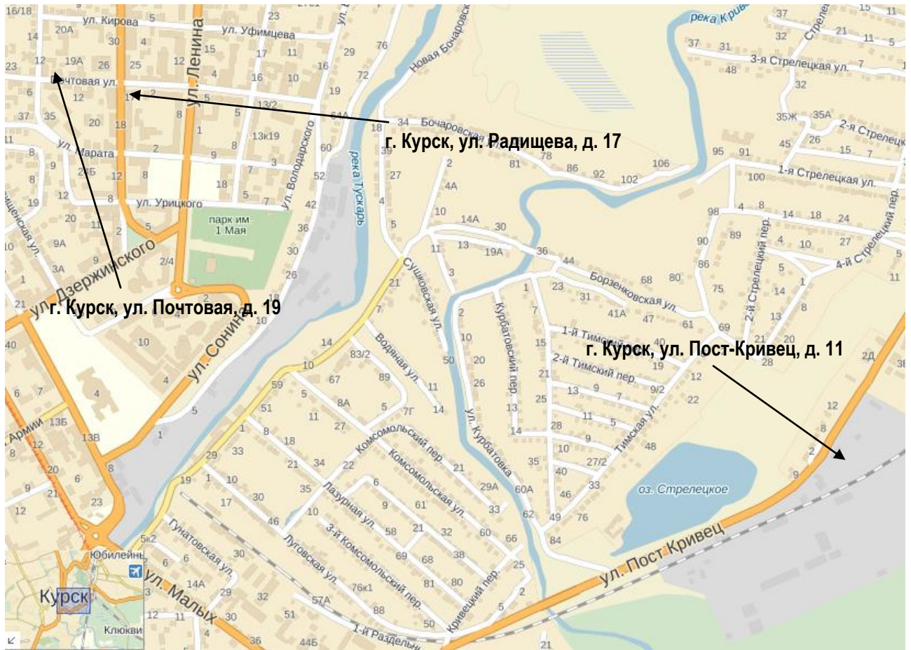
рис. № 1. Карта-схема расположения недвижимого имущества Общества в г. Курск

Далее представлена карта-схема расположения имущественного комплекса Общества.