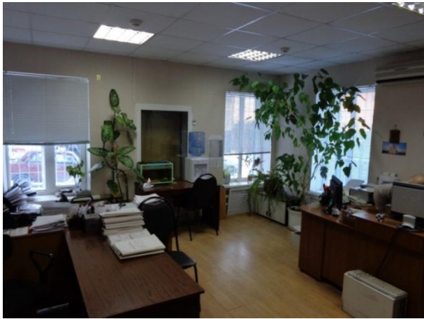
Фото 5. Офисные помещения