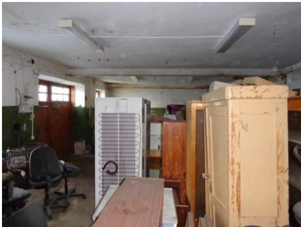
Фото 7. Складские помещения