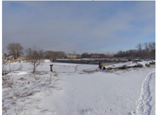
Фото 22. Ж/д тупик