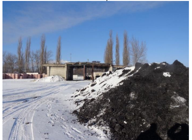
Фото 10. Имущественный комплекс по адресу: г. Курск, ул. Пост-Кривец, д. 11