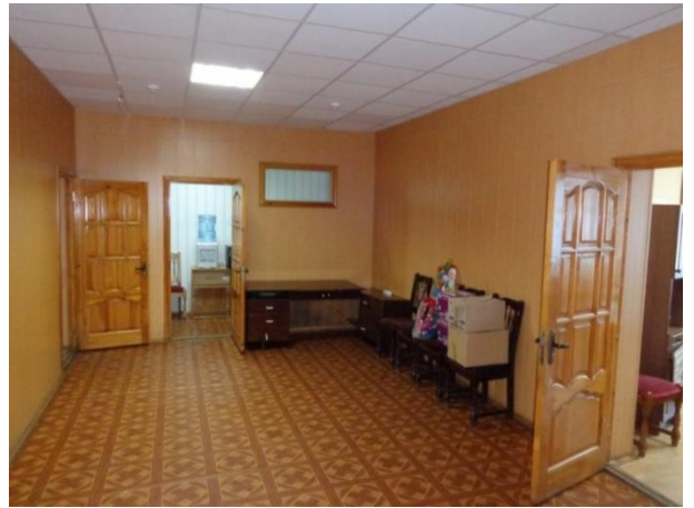
Фото 6. Офисные помещения