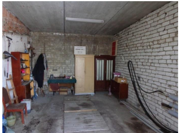
Фото 8. Гараж